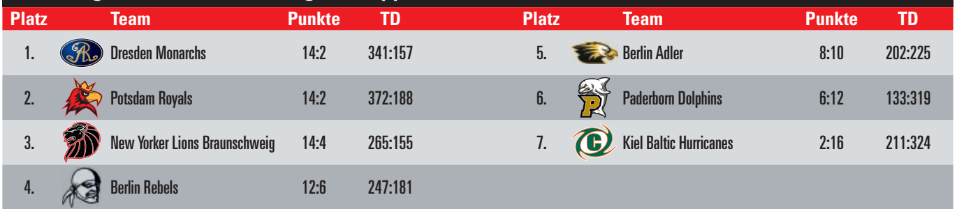
Tabelle Liga German Football League: Gruppe Nord